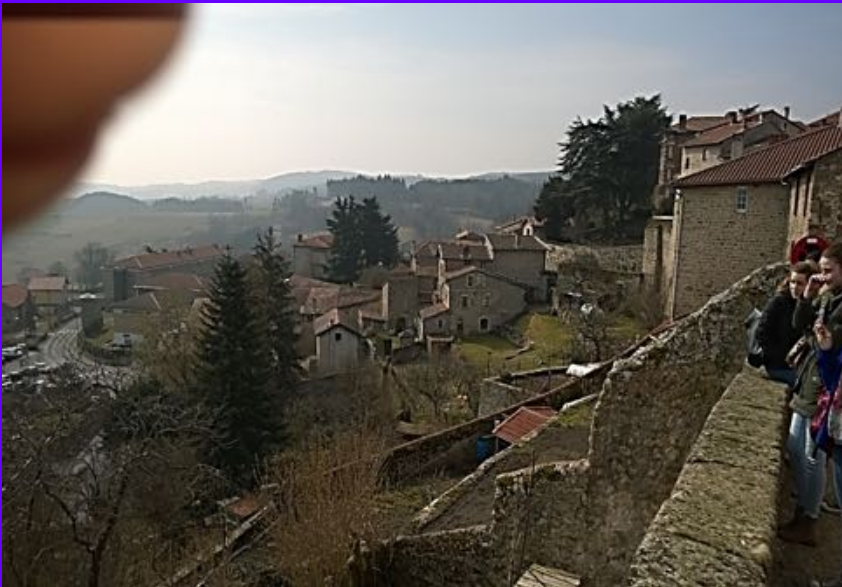
Saint Bonnet le Château / Loire